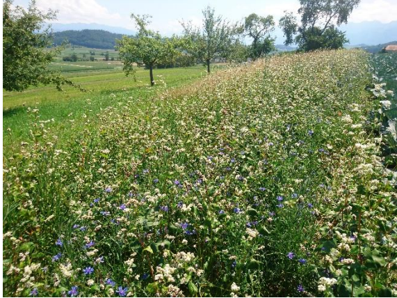
Abbildung 3: Nützlingsstreifen im Kohlanbau.

*** Gemäss ÖLN gilt für die Nützlingsstreifen gleich wie für die übrigen Ackerkulturen eine Anbaupause von zwei Jahren am selben Ort.