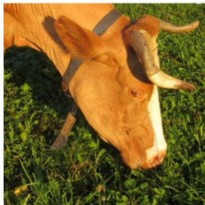
Abbildung 1: Swissfleckvieh-Kuh Berge, die älteste Kuh aus der FiBL-Herde

Die geschlachteten oder verendeten Kühe werden dem Betrieb angerechnet, auf dem die Kuh zuletzt abkalbte. Erfolgte die letzte Abkalbung auf einem Sömmerungs- oder Gemeinschaftsweidebetrieb, so wird die Kuh dem Ganzjahresbetrieb angerechnet, auf dem sie vor der letzten Abkalbung ihren Aufenthalt hatte (Art. 37 Abs. 7 und 8 DZV).