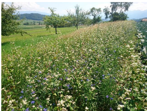
Figure 3 : Bandes semées pour organismes utiles dans une culture de choux.